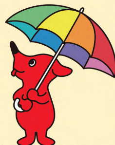
千葉県マスコットキャラクター 「チーバくん」

今回は、様々な疾病の中から、特に周りの大人が気づきにくい疾病の内容、気づきのポイント、学校の対応ポイント等をリーフレットとしてまとめましたので、ご活用ください。