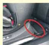
チャイルドシート側 ISO-FIXコネクタ