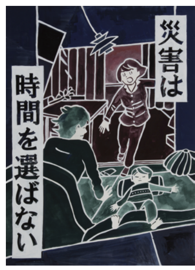
高校生・一般の部 鹿児島県 公務員 野崎 正博さん

お問合せ 〒150-0002 東京都渋谷区渋谷2丁目10番地9号 野村ビル2F 「第40回 防災ポスターコンクール事務局」 (株式会社ポイントラグ内) 電話 03-5485-5339 受付時間 平日/午前 9:00~12:00 (土・日・祝日を除く) 午後 13:00~17:00