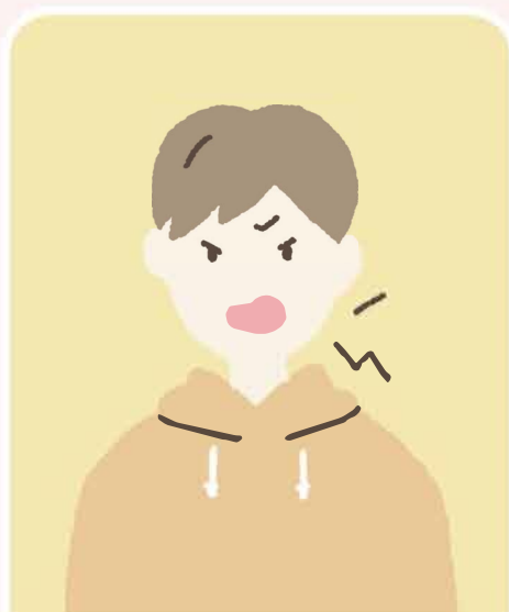
怒りやすくなった