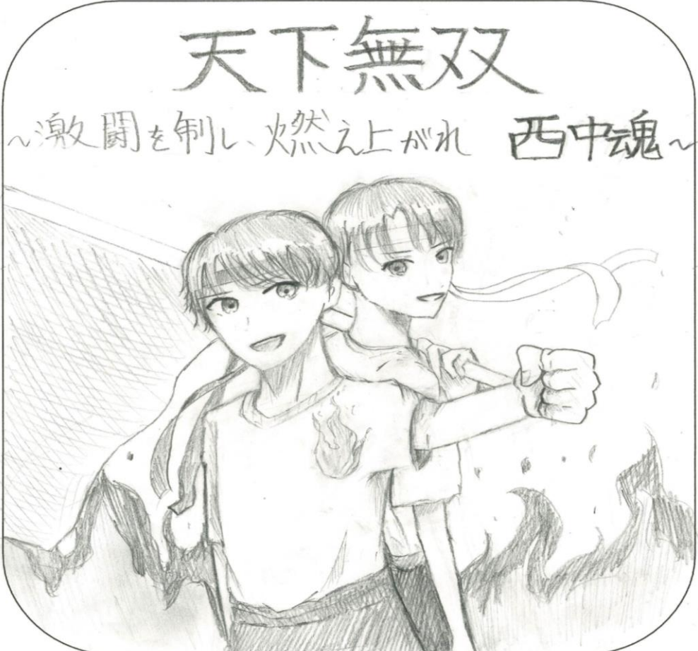
プログラム表紙絵: 3-3

色塗りされている箇所が保護者参観可能エリアになります。参観場所を変える場合には2号館と3号館の間を通過して移動してください。※3年生の後ろは通れませんのでご注意ください。 保護者利用可能トイレは2号館、生徒利用可能トイレは外トイレとなります。 トラロープ内は生徒の活動場所となるので立ち入らないようにしてください。可能な範囲で距離をとって参観するようにお願い致します。