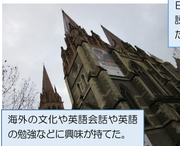
海外の文化や英語会話や英語の勉強などに興味を持てた。

日本の文化や伝統、印西市の魅力や場所などをたくさん説明したり、逆にオーストラリアでの生活の仕方を聞いたり好きな食べ物を聞いたりすることができた。