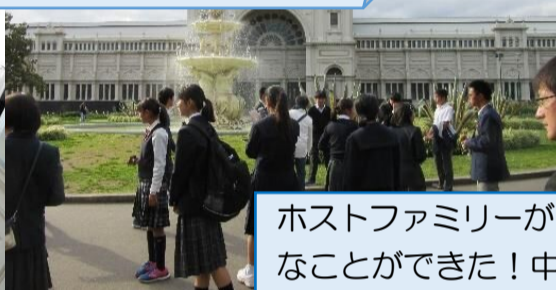
ホストファミリーがとても優しく、一緒に色々なことができた!中でも最終日にショッピングに連れて行ってくれたり、一緒にマフィンを作ってくれたりしたことが一番嬉しかった!