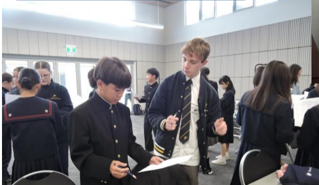
オーストラリアの文化や伝統を学べたし現地校の生徒とも交流したり、日本では受けることができない授業を受けることができた。