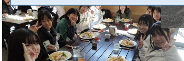
先生たちが皆優しく、英語なのに面白く授業を受けることができたのが良かった。

聞き慣れていない英語で話を聞き、オーストラリアのことをたくさん学べたので、とても力がついた。