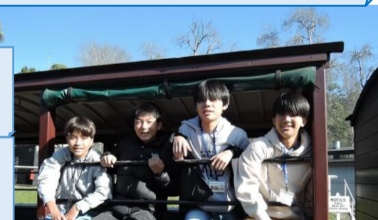
ホームステイ初日から家族のみんなとたくさん交流することができた。

外国と日本をつなぐ仕事をしている人がとてもかっこよかったので、将来について考える幅が広がった。