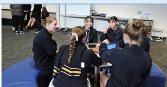
伝統的な踊りや料理など、見たり聞いたりだけでなく実際の体験ができた。