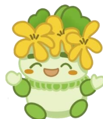
千葉県子どもと親のサポートセンター マスコットキャラクター こざぼん