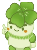
千葉県子どもと親のサポートセンター

<千葉県子どもと親のサポートセンター住所> 〒263-0043 千葉市稲毛区小中台5-10-2 千葉県子どもと親のサポートセンター 支援事業部 電話 043-207-6028