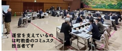
運営を支えているのは町教委のコミュスク担当者です

協議会の運営は、毎回すべて町教育委員会が担当します。これにより、学校の負担は大きく軽減でき、熟議や課題解決に向けた具体的な取組に集中できます。日頃から教育委員会が協議会に深く関わり、学校や地域と連携することで、子ども園・小・中学校と地域が一貫性のある意識をもつことができます。学校のニーズに合わせた行政対応も速やかです。