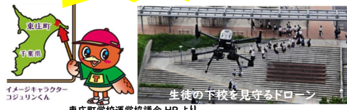
東庄町学校運営協議会 HP より

左横を向いたチーバクんの耳の辺りに「東庄町」があります。利根川沿いに広がる自然豊かな農業の町です。近年、ドローンを活用した地域課題の解決と地域実装に力を入れており、大きな注目を浴びています。町の学校は、こども園、小学校、中学校が一つずつ。このコンパクトさを生かした3校(園)合同の「東庄町学校運営協議会」が熱い！「地域とともにある学校づくり推進フォーラム2025千葉」の県代表の提案もしていただきました。(地域連携のススメ第32号参照)