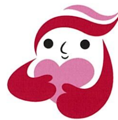
犯罪被害者等支援 シンボルマーク 「ギョuttoちゃん」

応募作品の中から、最優秀作品(国家公安委員会委員長賞)を決定します。 受賞者には、警察庁より9月頃にご連絡し、犯罪被害者週間において、表彰を行います。