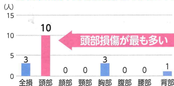
自転車乗用中死者損傷部位(令和6年)